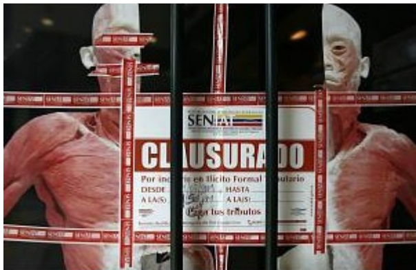
Fig. 1. Fotografía de la clausura de la exposición Bodies, Revealed . Caracas, 4 de marzo de 2009

sido cedida la utilización de las mercancías sin previa autorización de la administración aduanera; y la clausura del espectáculo por incumplir la normativa de emisión de factura durante los días de funcionamiento, así como la clausura de la empresa por no tener los libros de compras y ventas en su establecimiento (SENIAT, 2009).