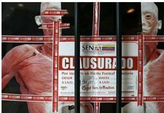
Fig. 1. Bodies, Revealed erakusketaren itxieraren argazkia. Caracas, 2009ko martxoak 4