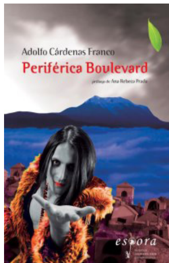
Portada edición chilena

Estas características son suficientes para entender lo que Periférica Blvd. genera en el espacio policiaco-barroco boliviano; no obstante, es vital enfatizar que este listado de invenciones y transformaciones no sería posible sin la presencia del humor construido con tanta eficiencia, lo que también constituye un giro profundo dentro del género, que eventualmente apela a la ironía y guiños humorísticos, pero que no se regodea en los aspectos más trágicos de la sociedad. Lo interesante es que tras la aparente degradación de los personajes —lo que precisamente hace reír si pensamos en la comedia— hay una crítica social muy dura, la cual vale la pena no solo para reírse en lugar de llorar, sino sobre todo para verla desde otro ángulo. Es así que todos los personajes resultan degradados, unos por otros, olvidando lugares y cargos, como ordenaría la fiesta o el carnaval.