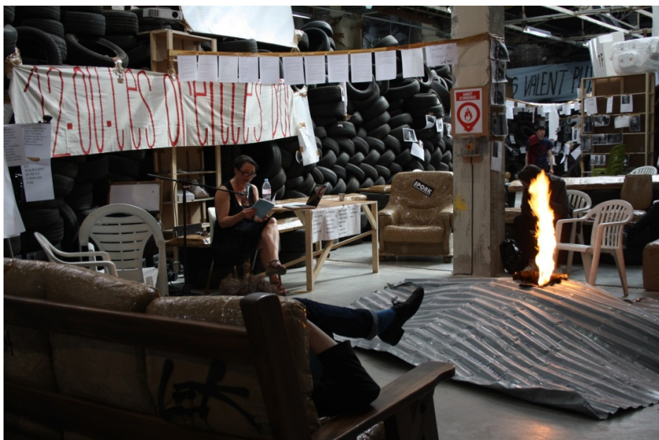
Thomas Hirschhorn, Flamme Éternelle (2014).

En realidad todo estaba lleno de elementos que buscaban la participación del espectador, y un buen ejemplo de ello eran las pancartas inacabadas que recordaban a los dazibao chinos. Colocadas entre un pilar y otro, funcionaban como decoración monumental por encima de los bloques de neumáticos y presentaban citas truncadas sobre la democracia, la revolución, el compromiso político, etc. Pensamientos que parecían guiar el recorrido por la instalación con la ayuda de los neumáticos, los cuales recordaban las antiguas barricadas y su característico olor a goma se mezclaba con el del combustible que mantenía encendida la llama que protagonizaba el conjunto. A medio camino entre la escultura monumental, el diseño y la arquitectura, este palacio se construía y reconstruía diariamente gracias a los grafitis, carteles, fotocopias y esculturas de porexpán realizadas por los visitantes. De ahí la afirmación del autor de que, más que una exposición, su propuesta consistía en la creación de una «situación de encuentro», es decir, en la creación de las condiciones óptimas para el encuentro de personas y conocimientos: «Acabo de crear un contenedor —afirmaba Hirschhorn—, una situación que invita a otros a estar presentes y activos con su pensamiento» (cit. por Lequeux, 2014).