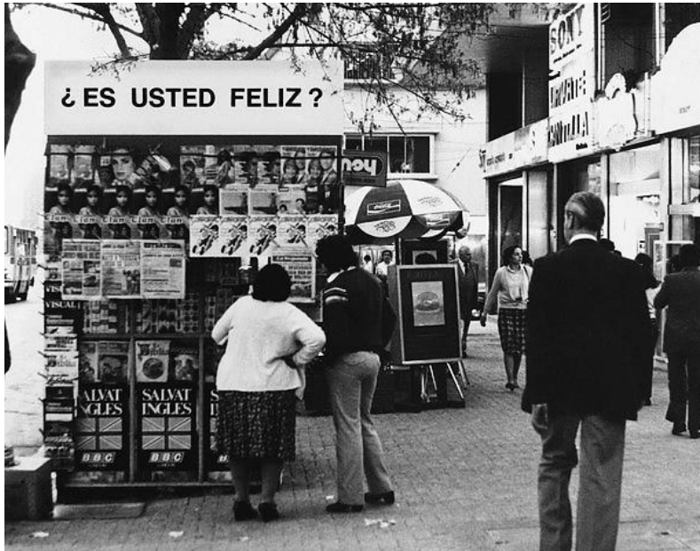
Alfredo Jaar, Estudios sobre la felicidad (1979-1981).