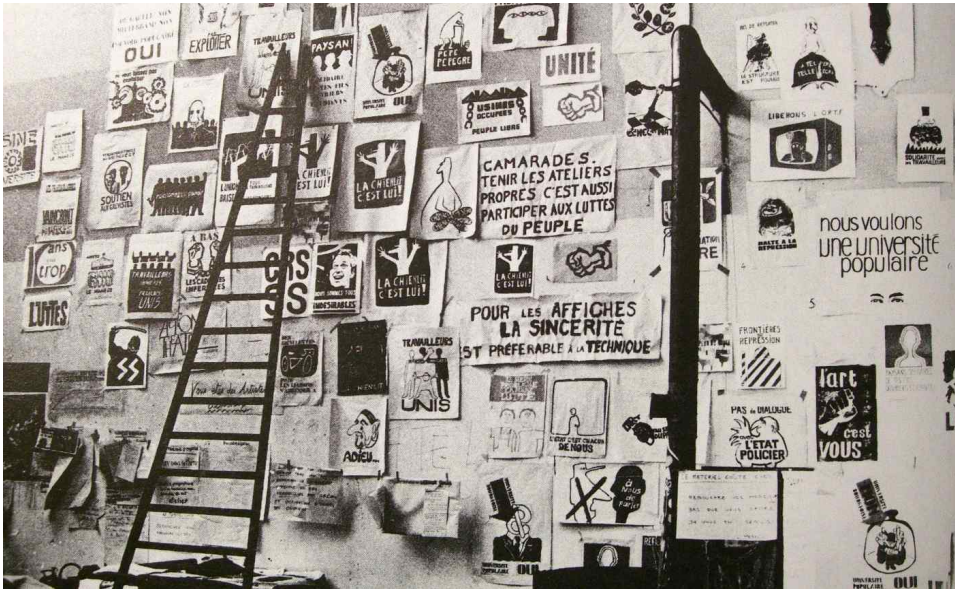
Atelier Populaire, ex-École des Beaux Arts (1968).